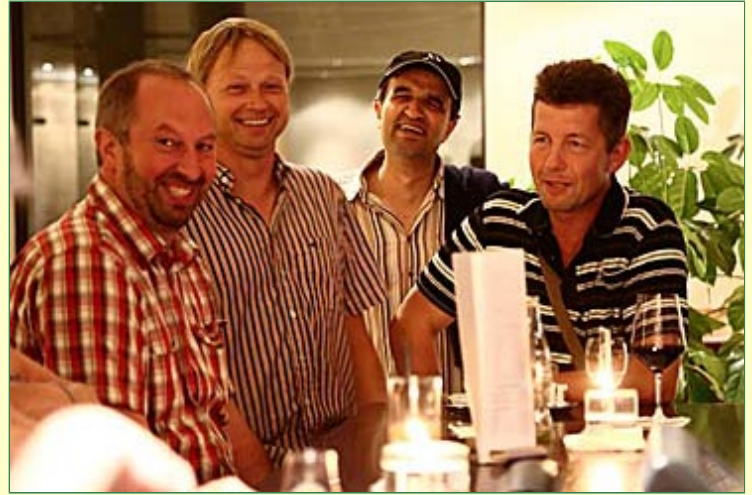
. . . und danach an der Hotelbar