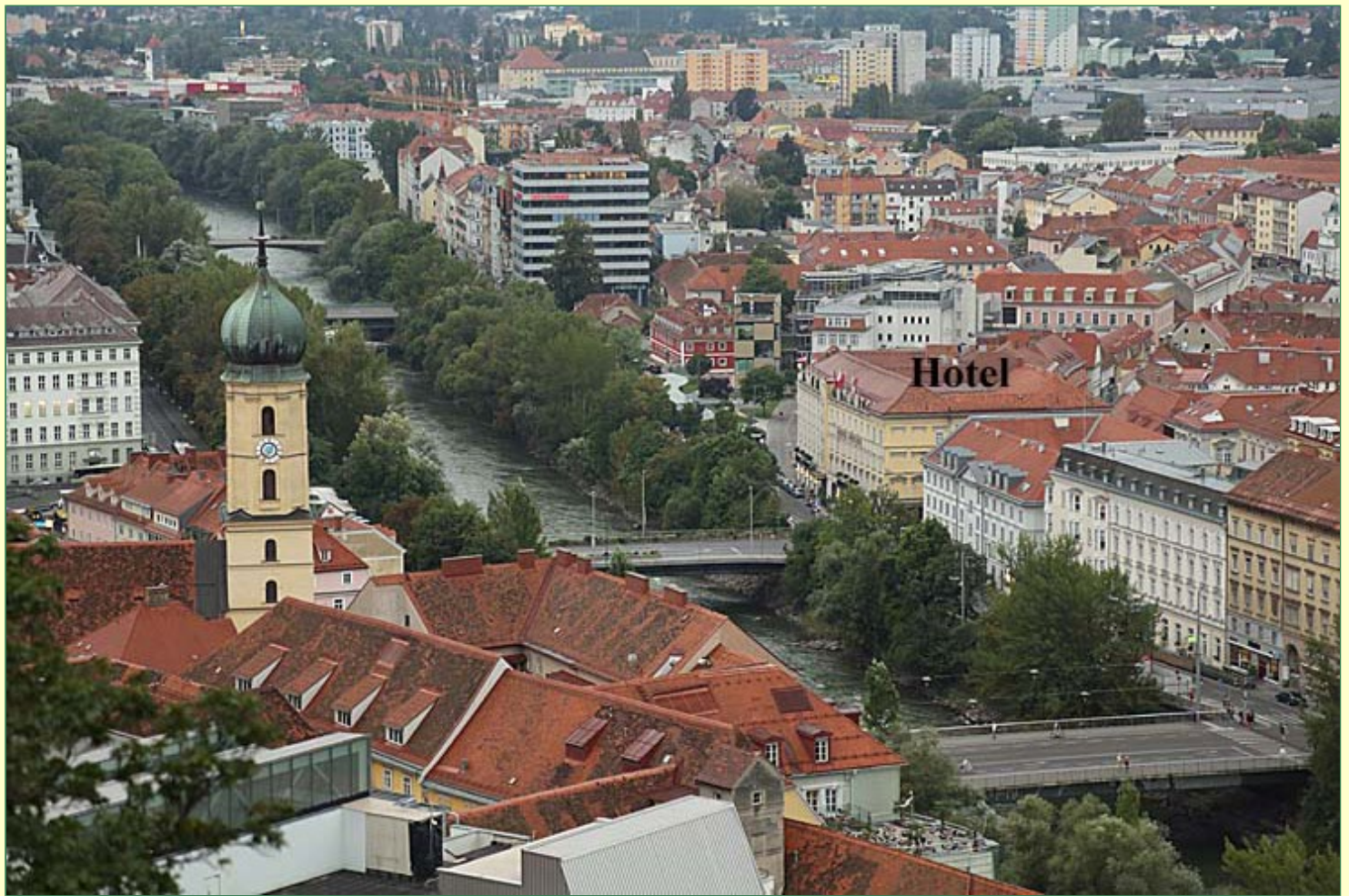
Blick auf Graz mit unserem Hotel