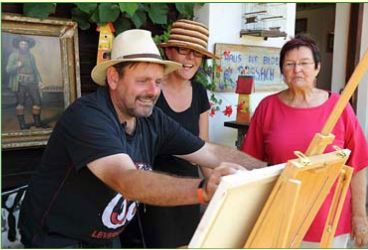
"Künstler" unter sich