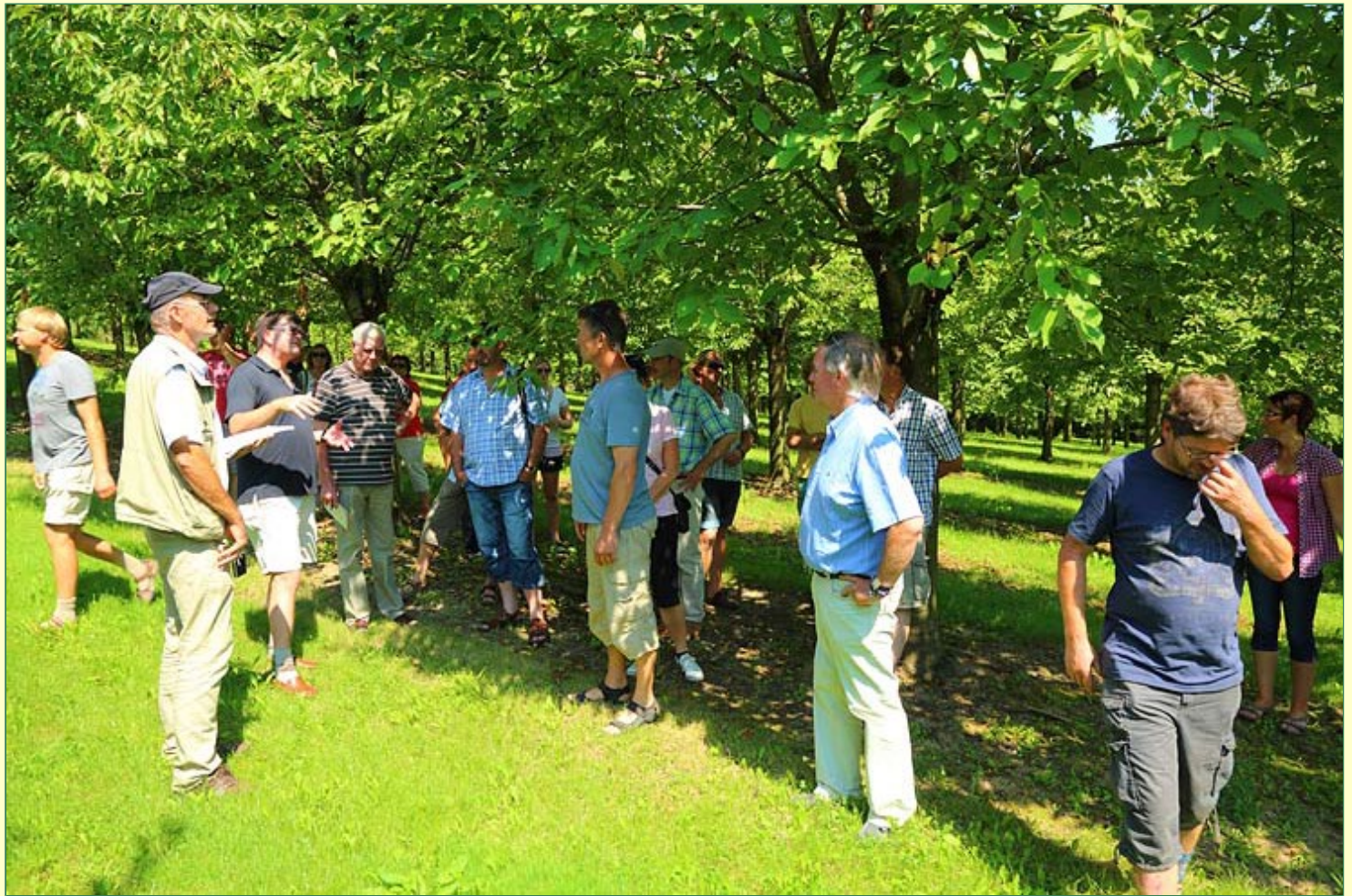
. . . ihre Steinobstproduktion zur Verwertung, vorallem als Brennobst