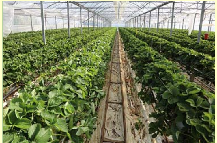
. . . mit 100% geschütztem Anbau