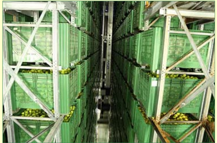
... und dem hochmodernen Hochregal-Kühlager: 29 GK übereinander