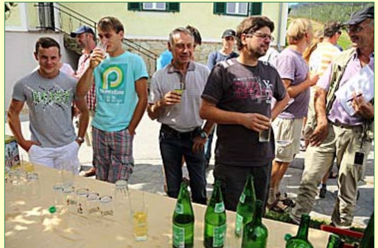
Erfrischende Getränke am Ende der Besichtigung