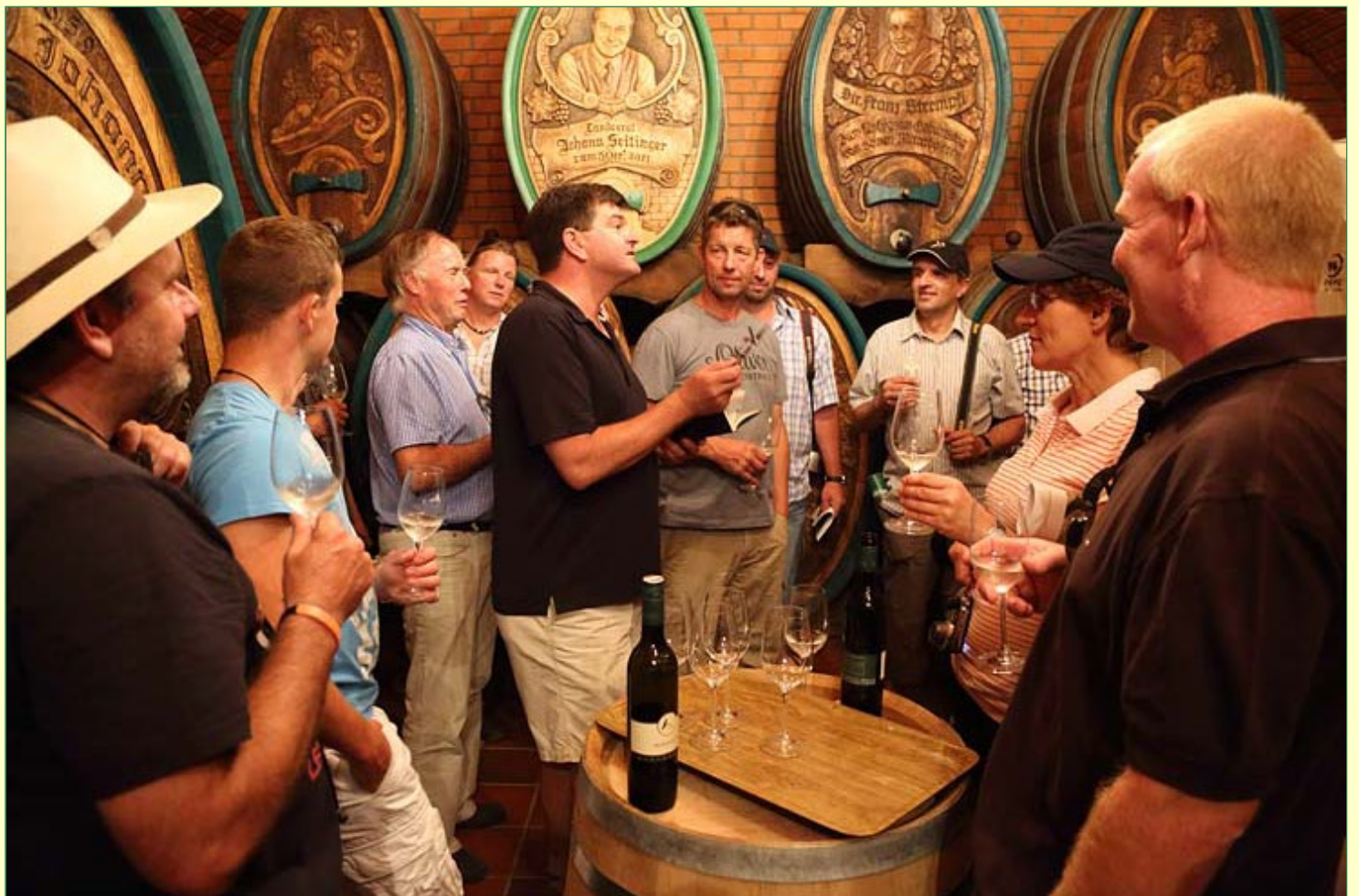
Anschließende Weinprobe in der Versuchsstation