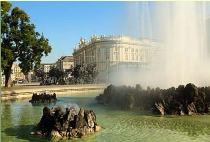
Wien, unsere letzte Station, hier am Schwarzenbergplatz