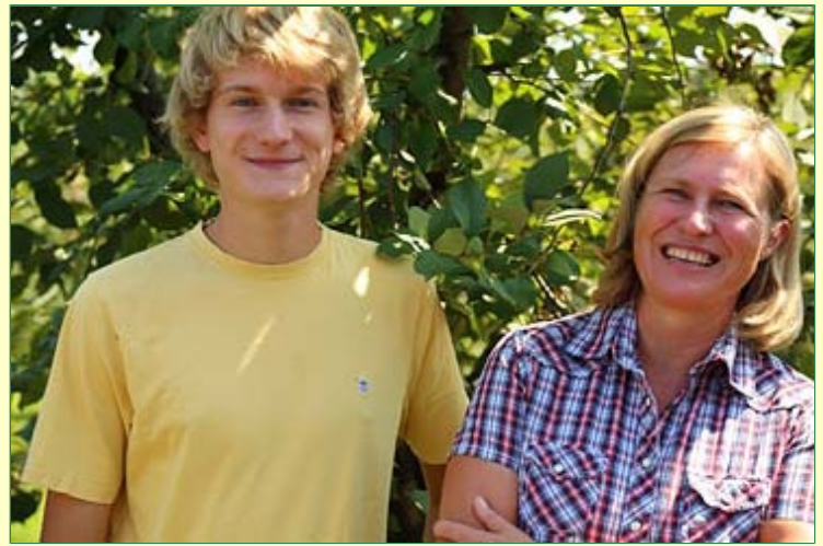
Ehefrau und Sohn Steinbauer zeigen uns . . .