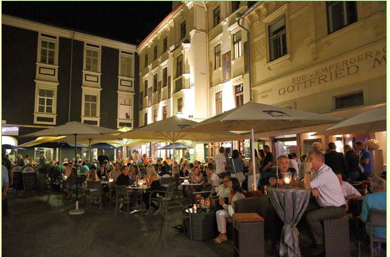
Danach Treffen in der Altstadt zum kühlen Bier