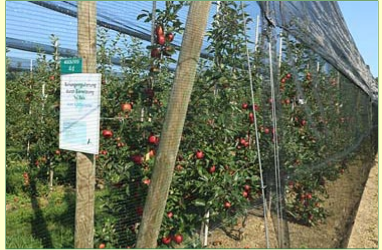
Behangregulierung durch Einnetzung