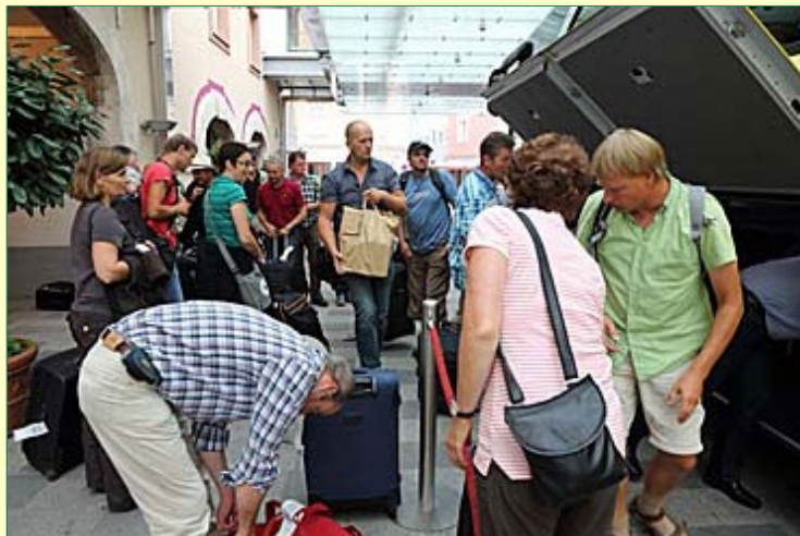
Ankunft am Hotel