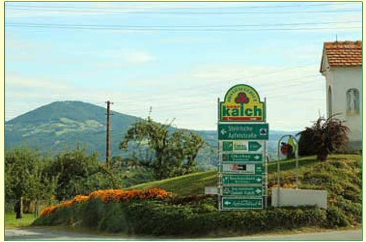
Auf der "Steirischen Apfelstraße" nach Kalch