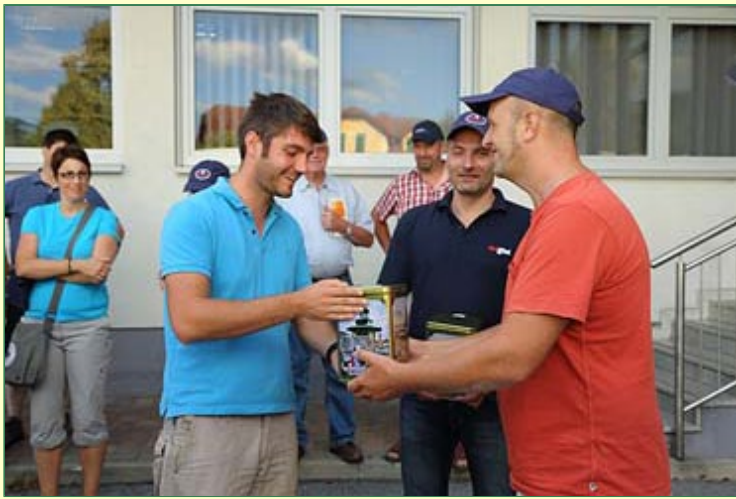
Haribo . . . und Erwachsene ebenso!