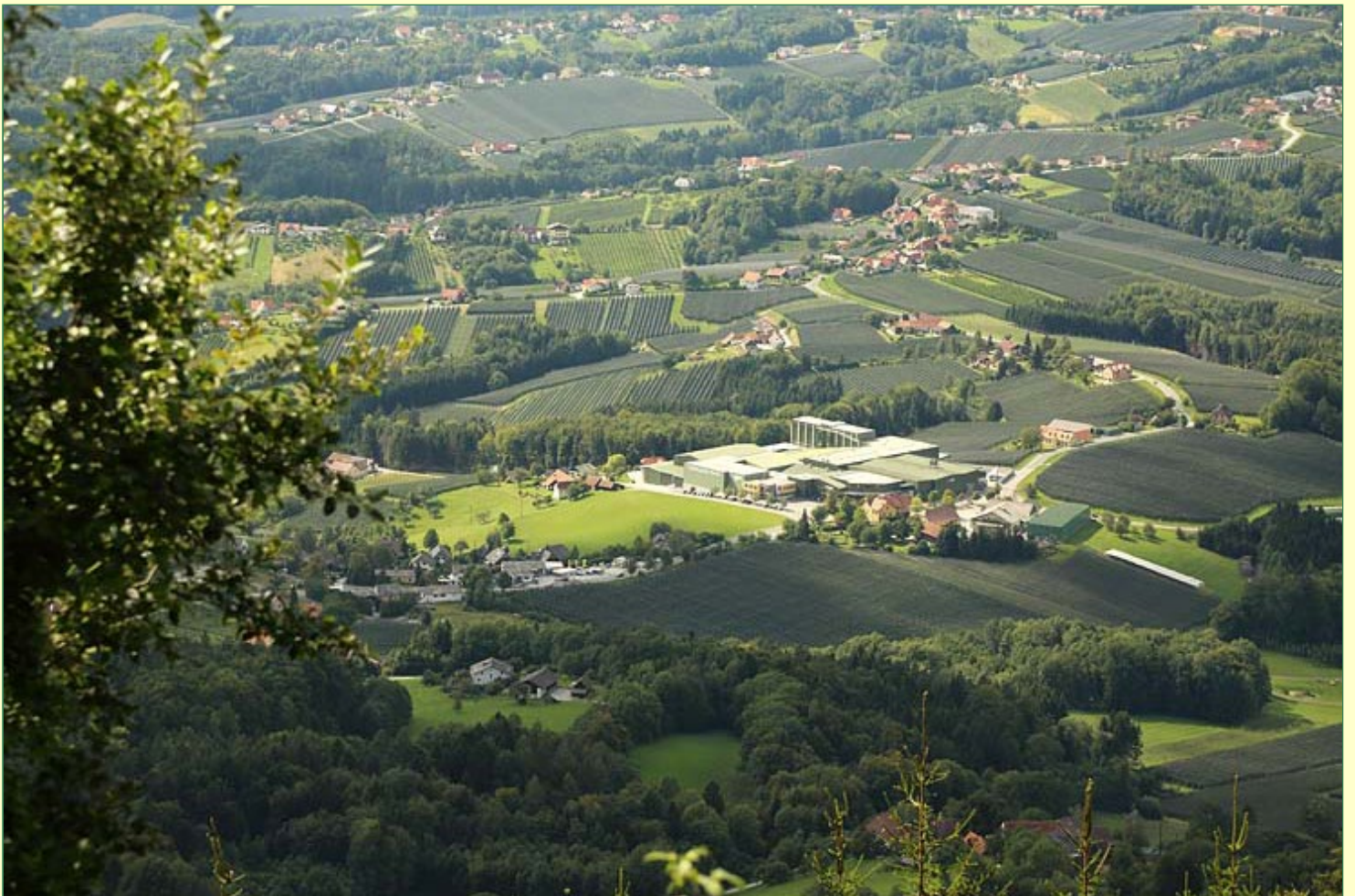
. . . und auf den Obstvermarktungsbetrieb "Gössl" mitten drin