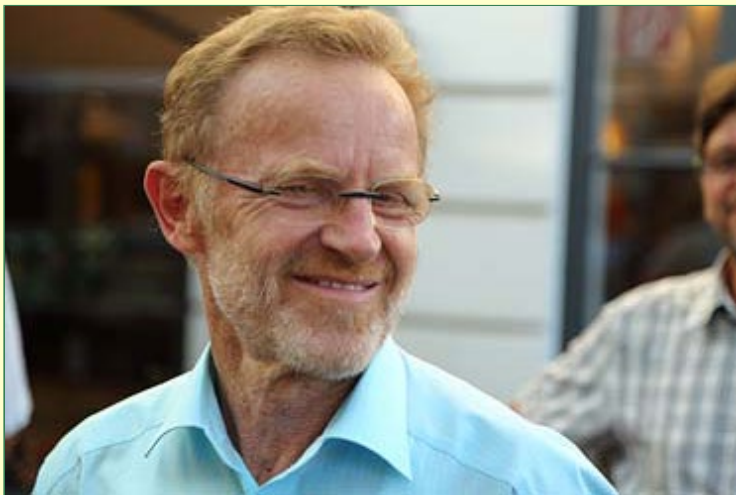
Einladung zum Abendbüffet in der LK in Graz . . .