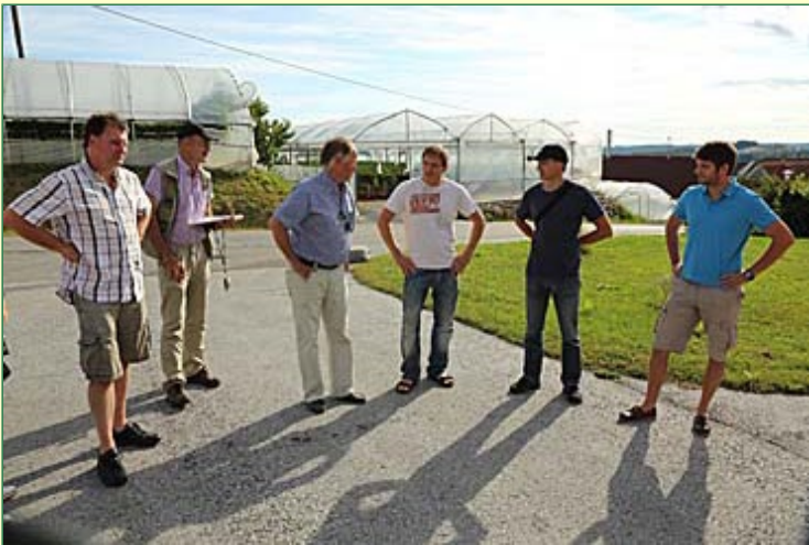
. . . zum Erdbeerbetrieb "Gutmann"