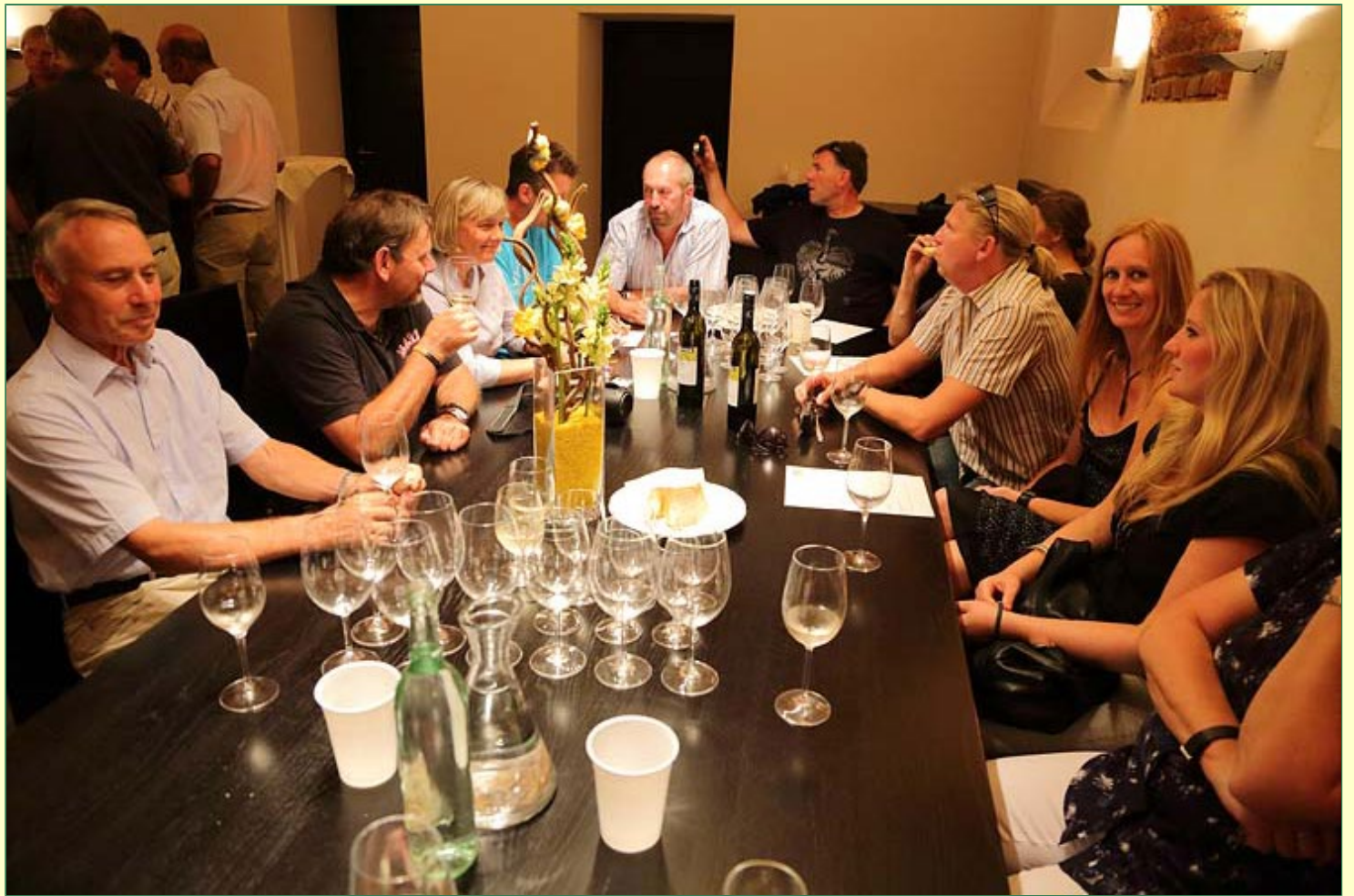
... und zur anschließenden gemütlichen Weinprobe im Keller der LK