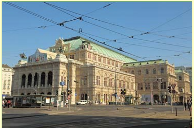
Die Staatsoper zählt zu den bekanntesten Opernhäuser der Welt