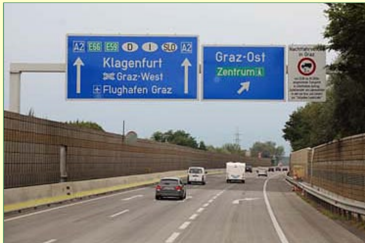
Auf nach Graz, im Herzen der Steiermark