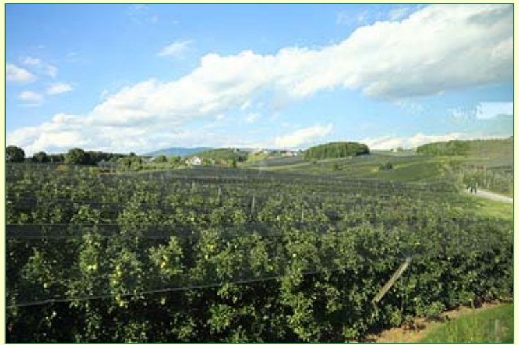
Schwarze Hagelnetze soweit das Auge reicht