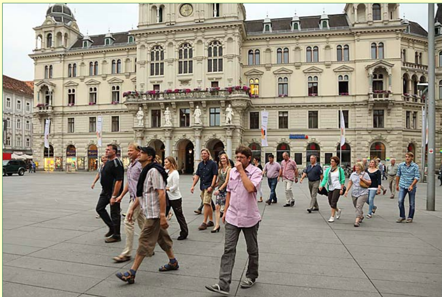
Vor dem Rathaus in Graz