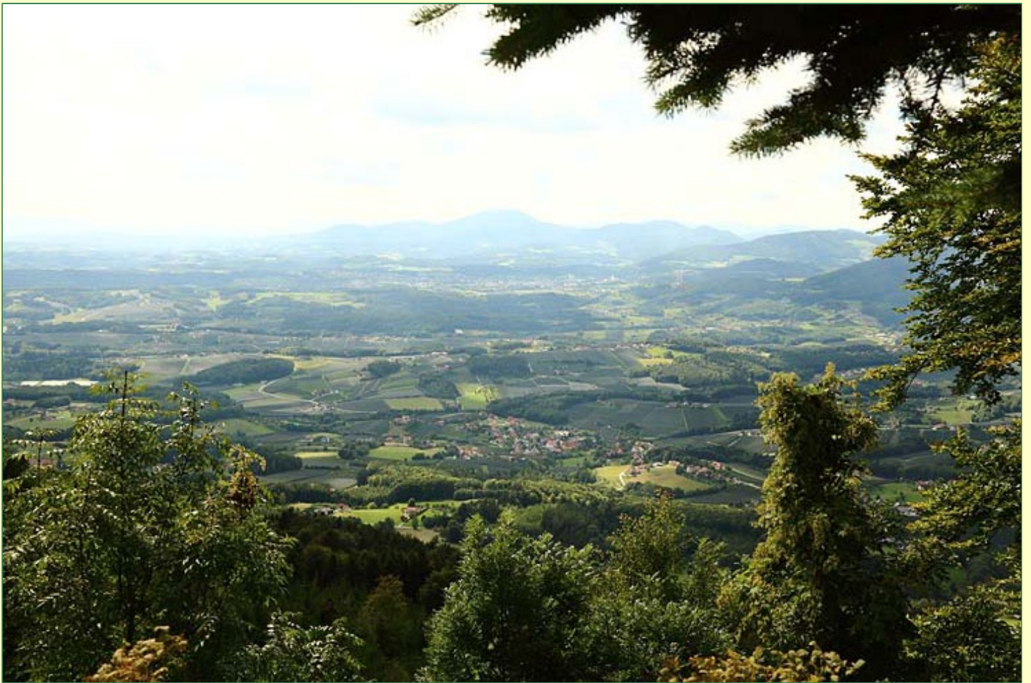
Blick vom Kulm auf die weite Kulturlandschaft