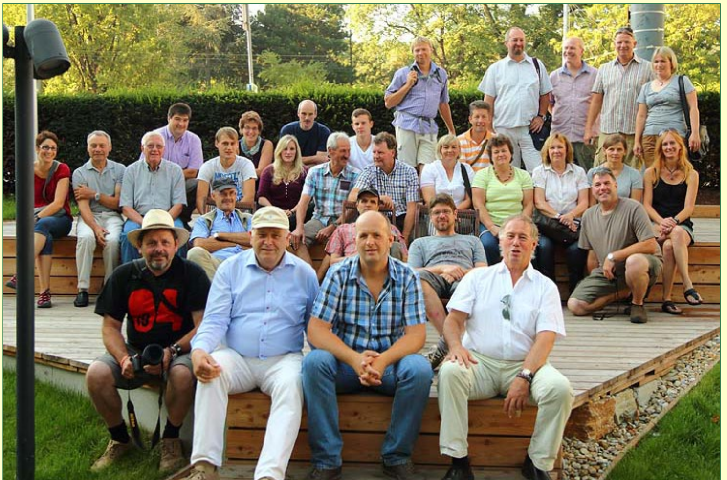
Die Teilnehmer einer sehr gelungenen Lehrfahrt Teilnehmerliste Steiermark 2012