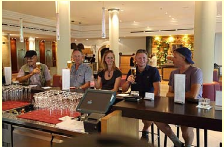
Kleine Stärkung an der Hotelbar