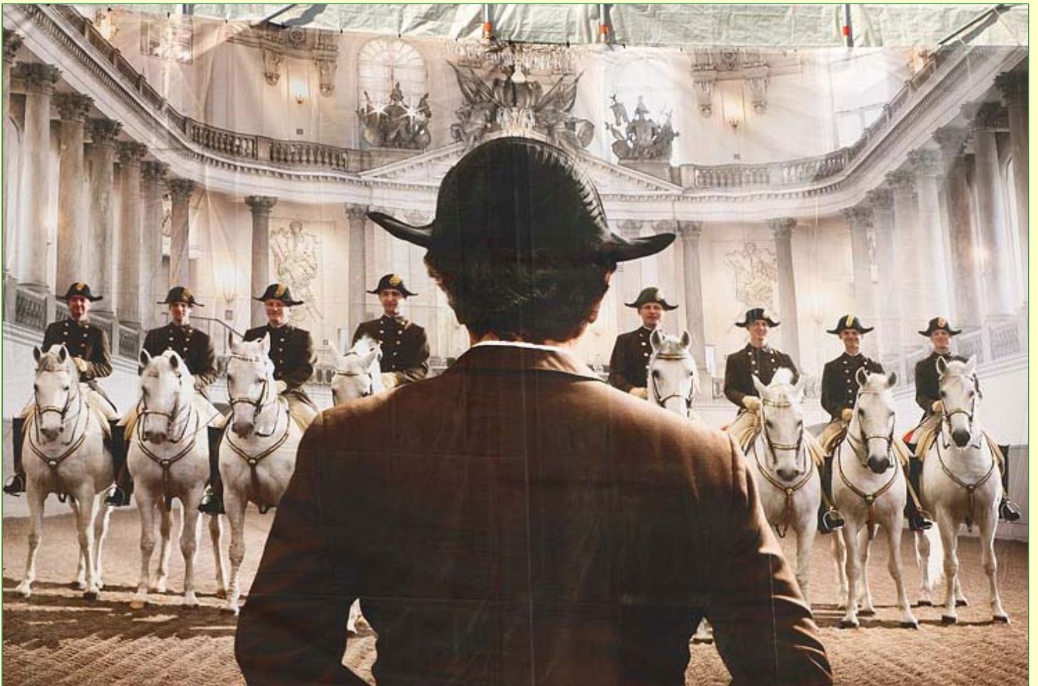
Die spanische Hofreitschule