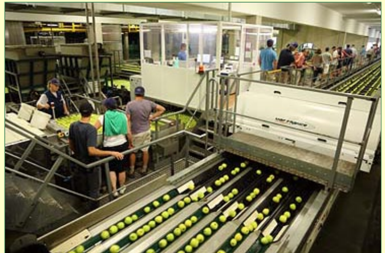
. . . zeigen uns den modernen Vermarktungsbetrieb