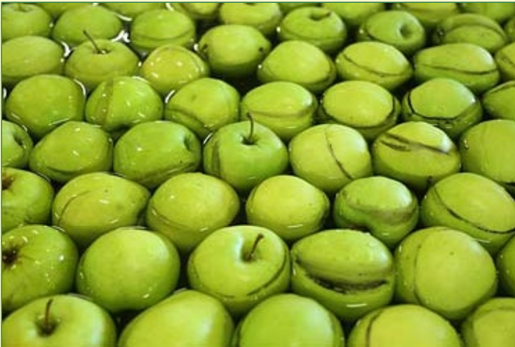
... mit kleiner Panne: Öl im Wasser!