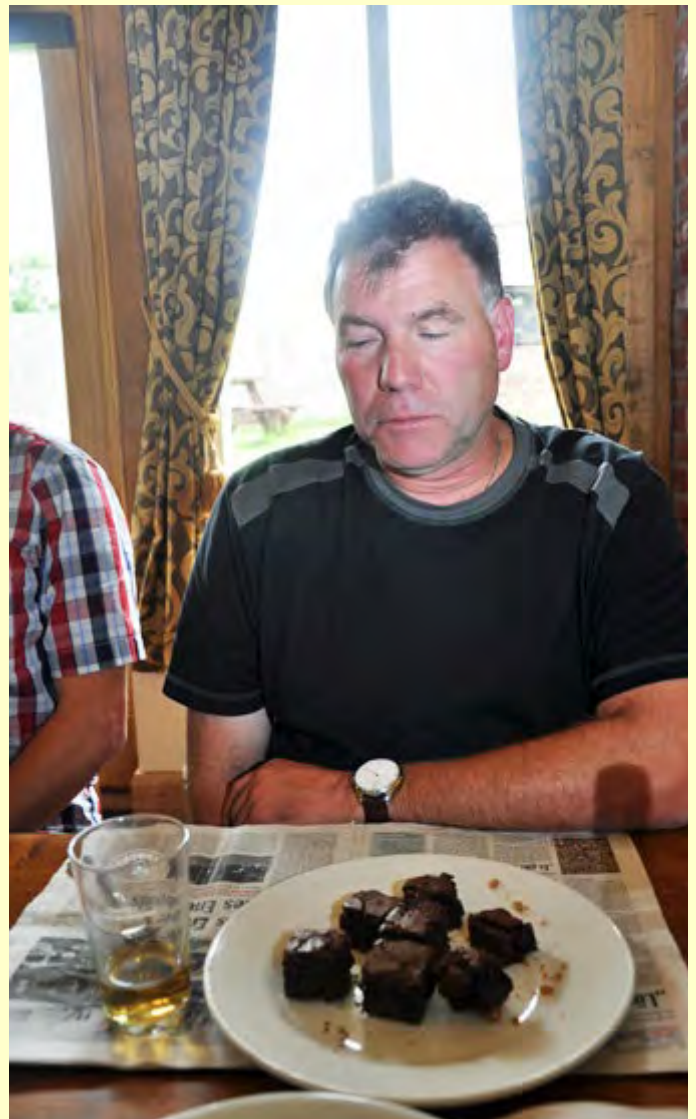
aber das schaff ich nicht, oder doch?